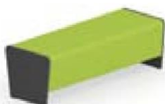
Magnes II 200 l 133 x s 50 x k 44 cm