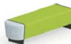
Magnes II 203 l 152 x s 50 x k 44 cm