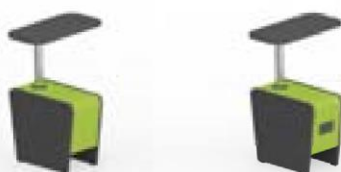
Magnes II 600 Magnes II 601 l 22 x s 50 x k 44+27 cm Kirjoitustason koko 28 x 54,5 cm