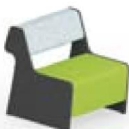
Magnes II 101 l 67 x s 76 x k 78 cm