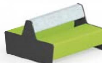
Magnes II 502 l 133 x s 126 x k 78 cm