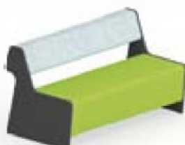
Magnes II 201 l 133 x s 76 x k 78 cm