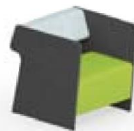
Magnes II 111 l 67 x s 81 x k 78 cm