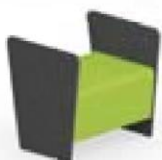
Magnes II 110 l 67 x s 56 x k 67 cm