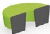
Magnes II 580 ZD l 126 x s 50 x k 44 cm