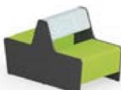
Magnes II 501 l 67 x s 126 x k 78 cm